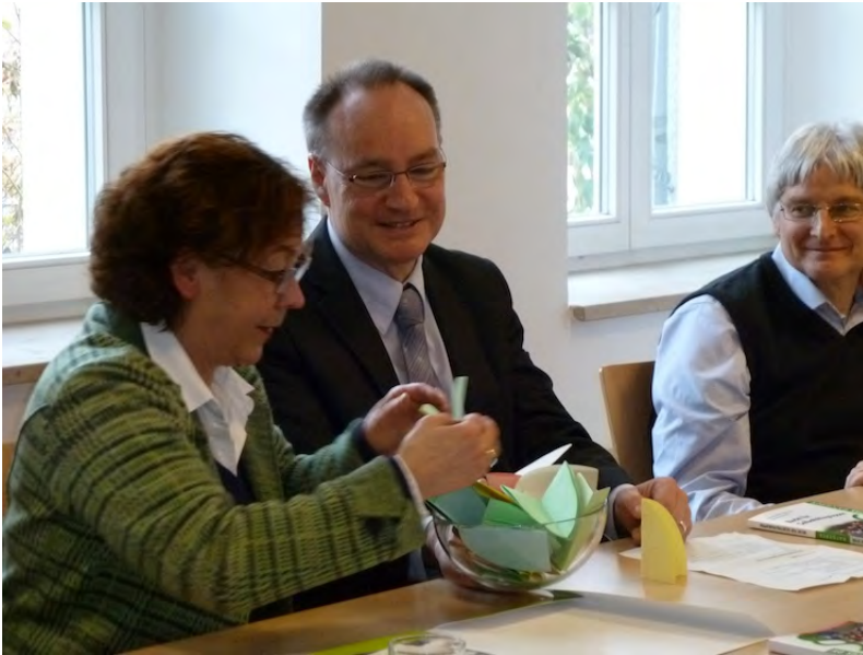
Die Autorin als „Glücksfee“: Verlosung von 5 Freixemplaren an Besucher/innen der Buch- präsentation.

Wir begannen recht bald, uns auch die neuen Themenfelder (s. unten) zu erschließen und offene Fragen zu klären. Dabei erschien es wichtig, uns zu manchen diffizilen Bereichen auch mit unserem Landes- und Bundesverband (SeKo in Würzburg und NAKOS in Berlin) abzustimmen. Im Dezember 2013 konnten wir schließlich eine zweite aktualisierte und erweiterte Auflage präsentieren, die „keinen Wunsch mehr offen lässt“ – was jedoch übertrieben ist, wenn man bedenkt, welche gesellschaftlichen und politischen Veränderungen mit der zunehmenden Digitalisierung unserer Kommunikations- und Organisationsstrukturen oder des zunehmenden Einwirkens von EU-Recht auf unsere nationale Rechtsprechung verbunden ist.