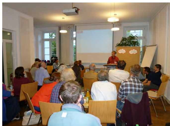
Gruppenvorstellungen: TransMann e.V., Lets Tauschnetz, Erektile Dysfunktion