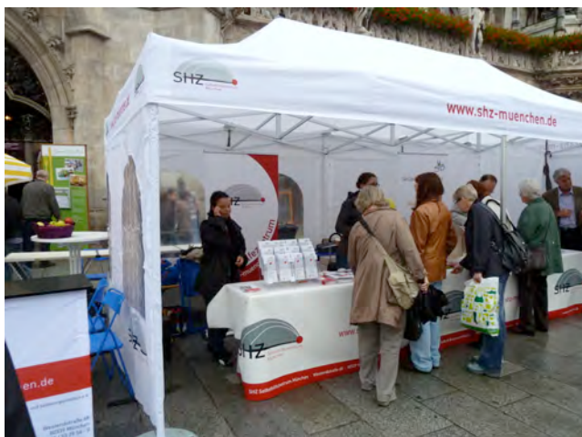
links: Pavillon des Selbsthilfezentrums München