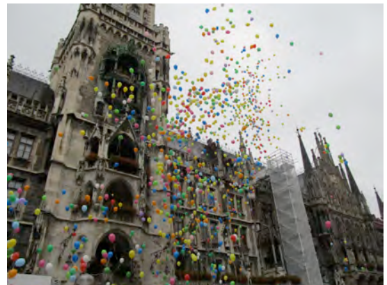
unten: Aufstieg von 1000 Luftballons zur Eröffnung des Tages