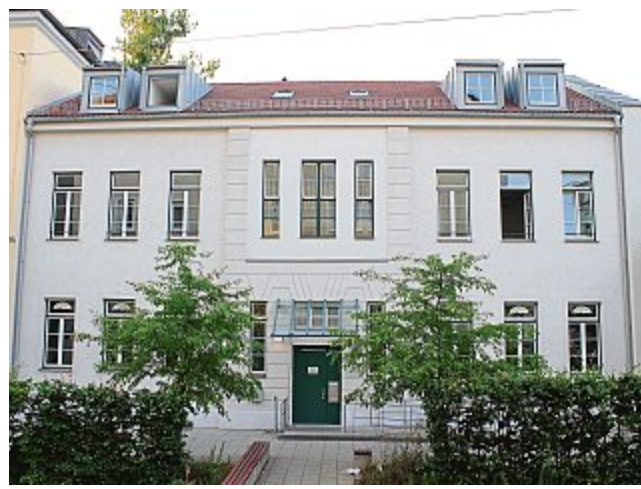
Das Selbsthilfzentrum (SHZ) an der Westendstraße 68 wird heuer 30 Jahre alt.

„Wer regelmäßig die Gruppe besucht, der hat nach unserer Erfahrung deutlich geringere Rückfallquoten“, sagt Mirjam Unverdorben-Beil, zuständig für die Gesund-