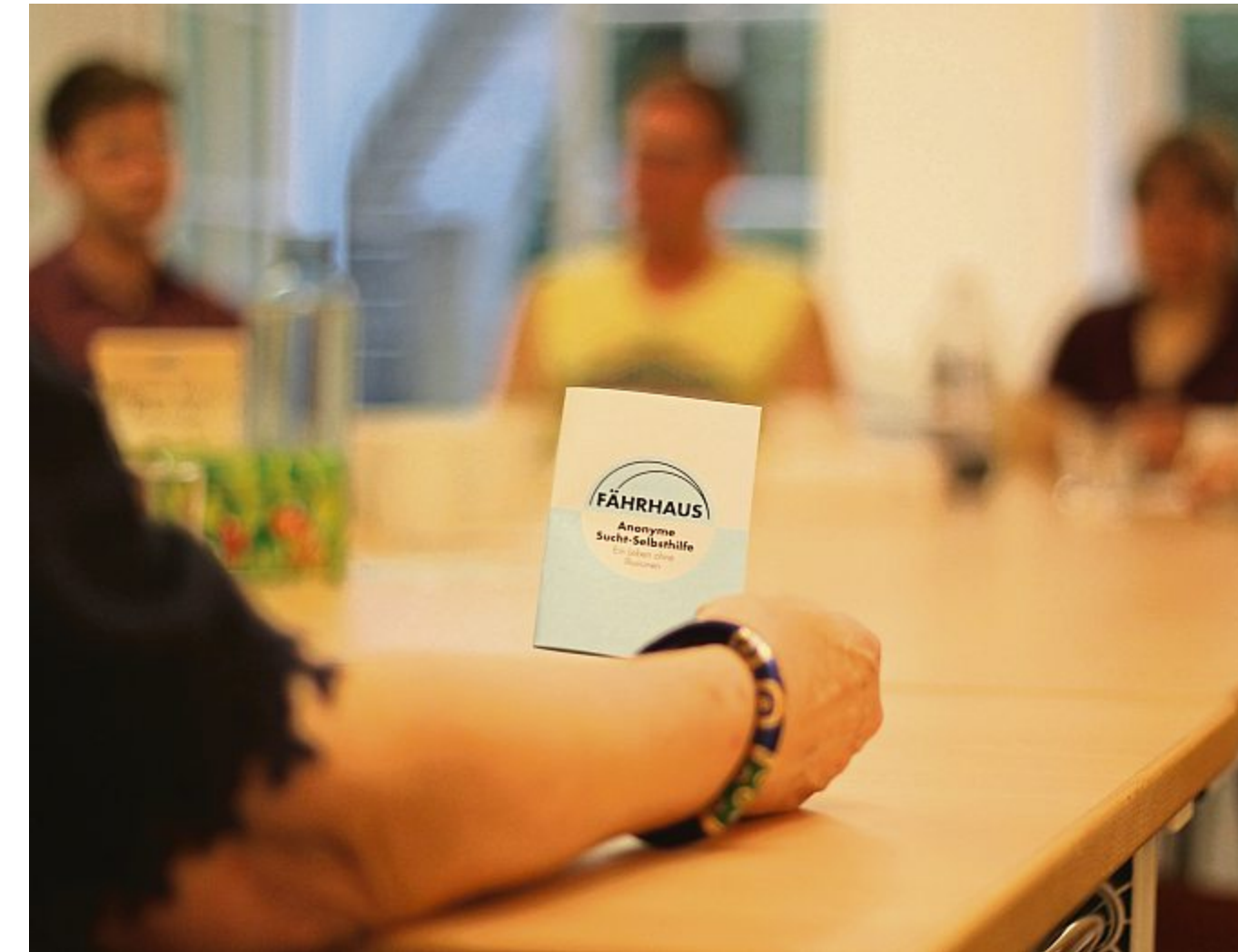
Alkohol, Tabletten, Heroin: Die Drogen der Fährhausgruppe sind verschieden, Schicksale und Herausforderungen dieselben.

Christa erzählt, dass sie heute erstmals wieder an ihrem Arbeitsplatz war. Um sich schon mal einzustimmen auf ihren ersten Arbeitstag morgen. Im Spint hing noch ihr Kittel. Als sie ihn heraus-