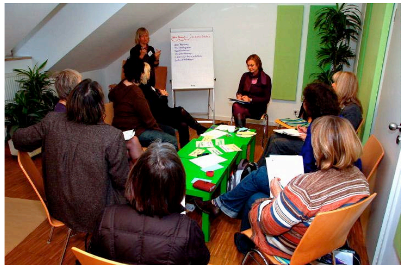
Arbeitsgruppe beim Fachtag

In den Arbeitsgruppen und informellen Gesprächen ergaben sich für viele TeilnehmerInnen neue Kontakte und Vernetzungsmöglichkeiten. Seitens einiger VerwaltungsvertreterInnen wurde der Wunsch geäußert, sich häufiger mit VertreterInnen der Initiativen der Familienselbsthilfe zu treffen, um deren Bedürfnisse besser im Blick zu haben und diese damit in der Steuerung und Förderung auch besser berücksichtigen zu können.