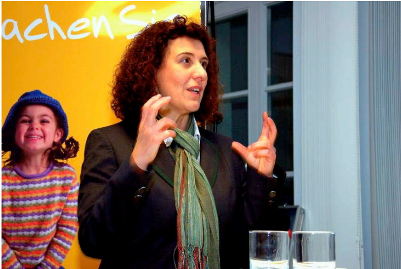
Brigitte Maier, designierte zukünftige Sozialreferentin der LH München

Ein großes Thema war auch die Frage der Räumlichkeiten, die Selbsthilfeinitiativen benötigen, um ihre innovativen Ansätze der gegenseitigen Unterstützung zu verwirklichen und über die Fördermittel, die in die Bezuschussung von Mietausgaben fließen.